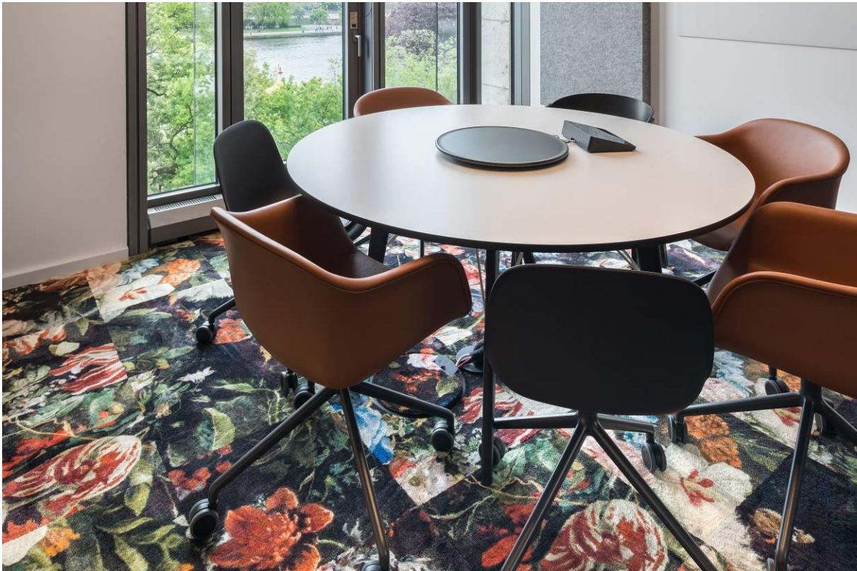
0802 GLOSSY VELOURS - SOFIA