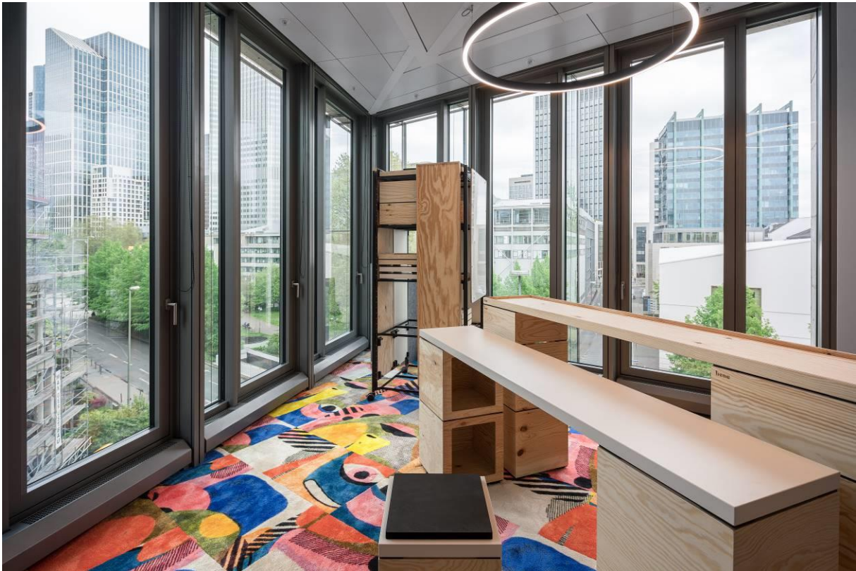
0101 Glossy Velours - SHARI