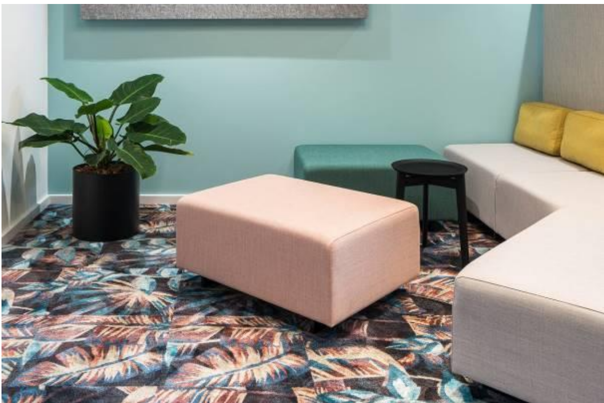
0604 Glossy Velours - JANE